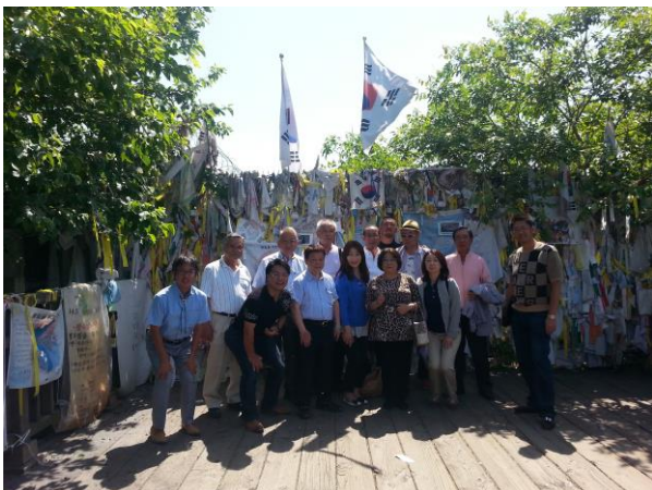
自由の橋 : 北朝鮮と韓国を結んでいた橋