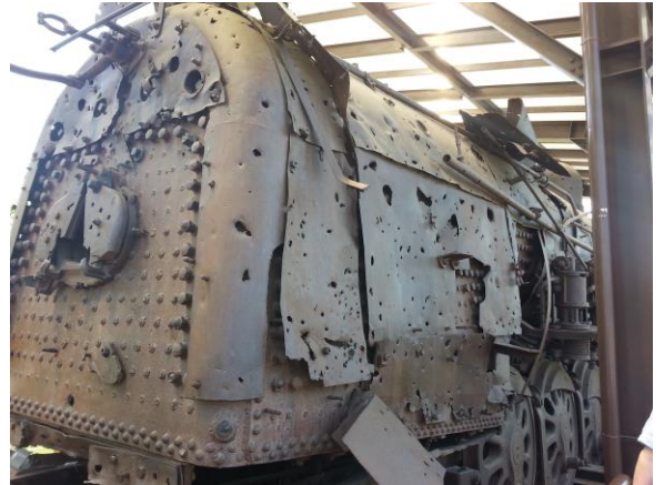
電車 : 北朝鮮と韓国を走っていた汽車