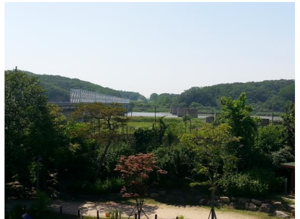
川の向こうは北朝鮮