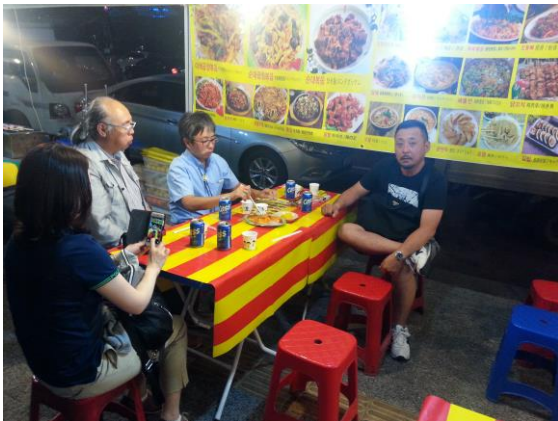
最終日 : 南大門の屋台