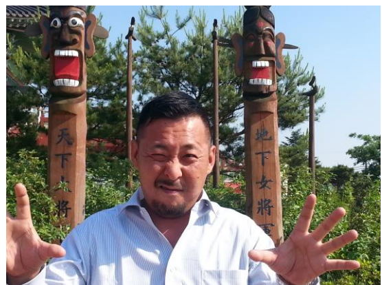
木村パワー充電中