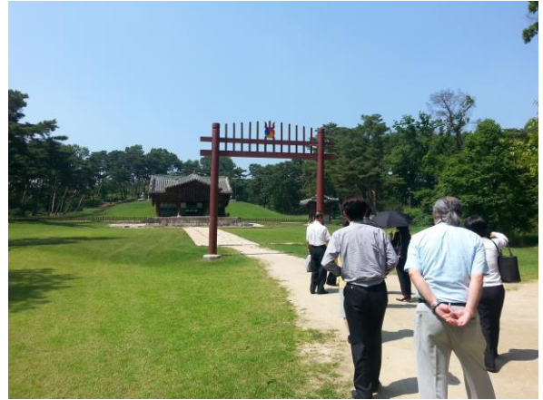
西五陵 : 王様お墓