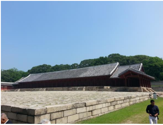
ソウビョ : 王様の魂を収めている